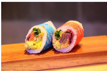
プレオープン時の様子